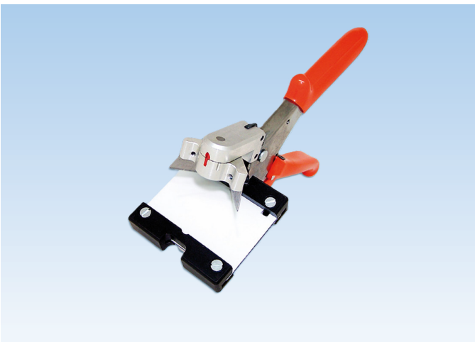
Ciseau à coupe-froid