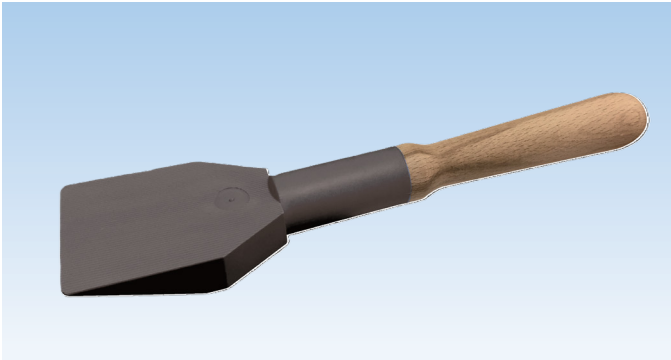
Levier de vitrier en plastique