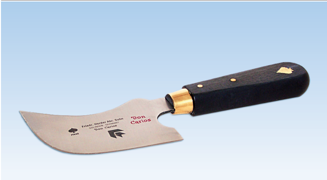
Couteau Don Carlos