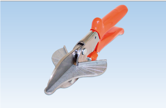
Ciseau à coupe-froid